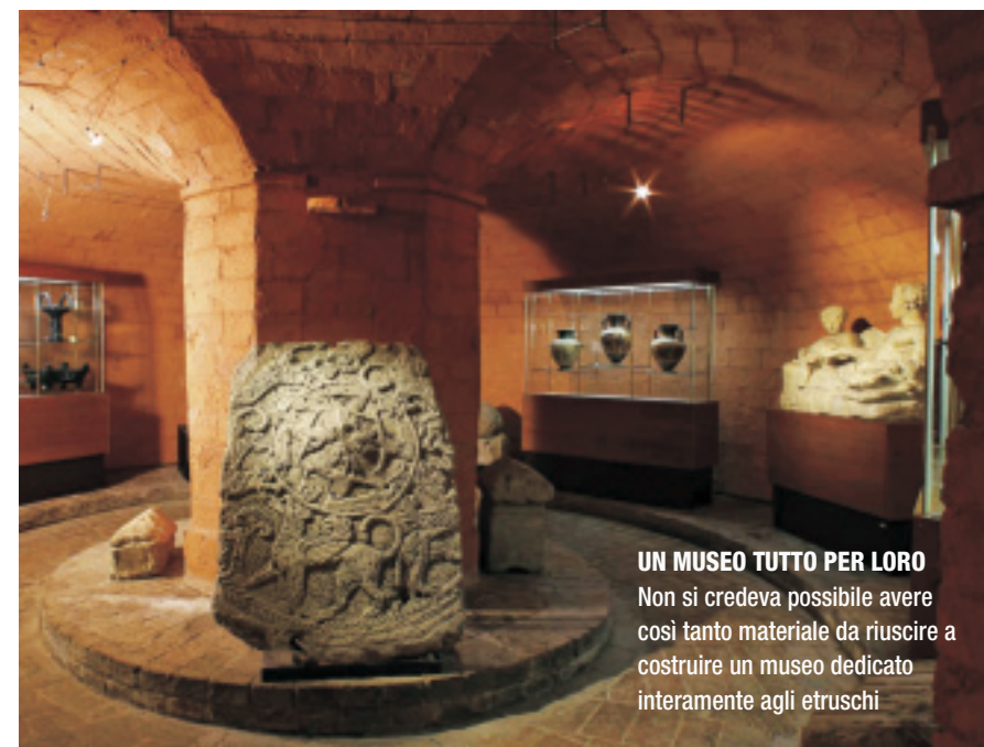
UN MUSEO TUTTO PER LORO Non si credeva possibile avere così tanto materiale da riuscire a costruire un museo dedicato interamente agli etruschi

Se questa è solo un'ipotesi suggestiva, certo è realtà il fatto che gli etruschi qui ci sono vissuti davvero. A Sarteano, borgo in apparenza di origini medievali, visto che la sua fisionomia è dominata dal torrione squadrato del castello. Invece, a poca distanza, alla necropoli delle Pianacce, basta voltare le spalle al Trasimeno per trovarsi alle porte di un mondo sotterraneo, misterioso e affascinante. La tomba è lì: varcarne la soglia, è come spingersi alle porte dell'Ade. Un lungo corridoio scavato