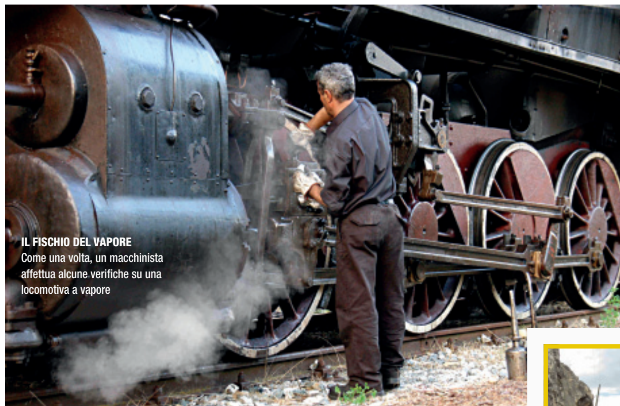
IL FISCHIO DEL VAPORE Come una volta, un macchinista affettua alcune verifiche su una locomotiva a vapore

Per gli amanti delle ferrovie sono molte le occasioni di salire su treni speciali, per una cro-