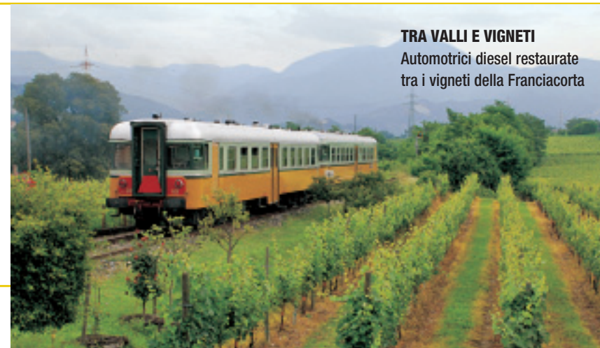
TRA VALLI E VIGNETI Automotrici diesel restaurate tra i vigneti della Franciacorta

Unesco. «È patrimonio mondiale in quanto esempio eccezionale di trasformazione socio-economica di un territorio isolato, quello delle Alpi Centrali, avvenuta all'inizio del XX secolo a seguito della costruzione della ferrovia. Quest'ultima è una testimonianza di