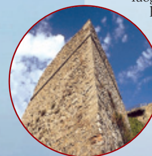
La fortezza di Marciana e uno scorcio del quartiere Il Cotone a Marciana Marina

«È successo tutto per caso. O forse il caso l'ho pilotato: avevo un profondo desiderio di tranquillità. È stato un amore a prima vista, quando ci sono andato un'estate degli anni